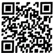
(นางสาวพรณิภา มณีเนตร) ท้องถิ่นอำเภอปทุมราชวงศา