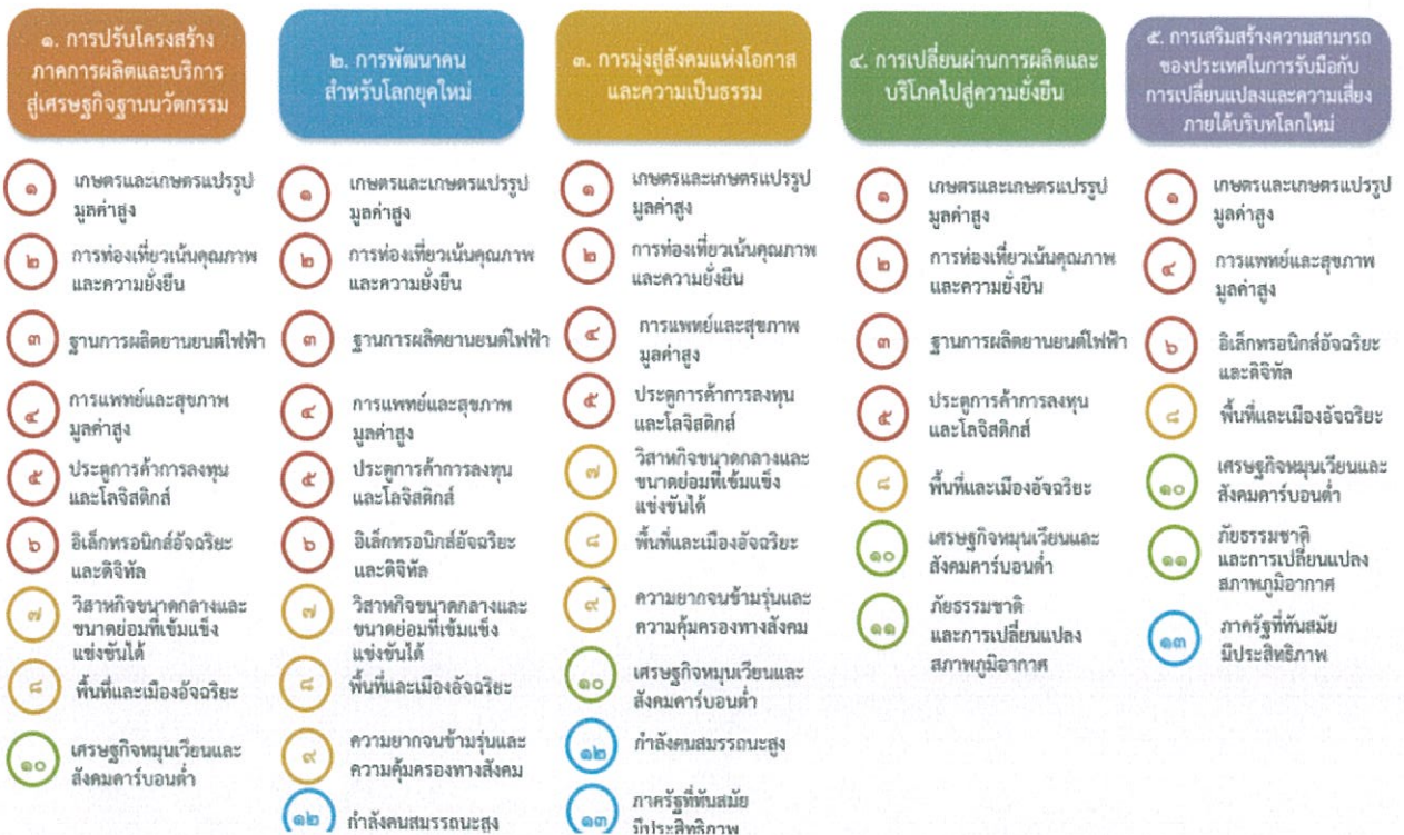
แผนภาพที่ ๓.๑ ความเชื่อมโยงระหว่างหมวดหมู่การพัฒนา กับ เป้าหมายหลัก